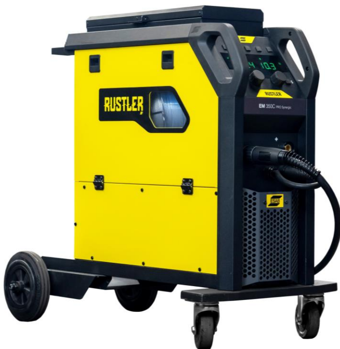
Rustler EM 350C PRO Synergic

Den kompakta svetsinvertern Rustler MIG PRO är ditt rätta val för de vanligaste svetsutmaningarna. Tack vare den senaste invertertekniken kombinerar låg energiförbrukning med optimerad svetsprestanda.