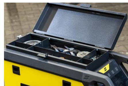
Verktöglåda som placeras på maskinens topp för tillbehör finns som tillval