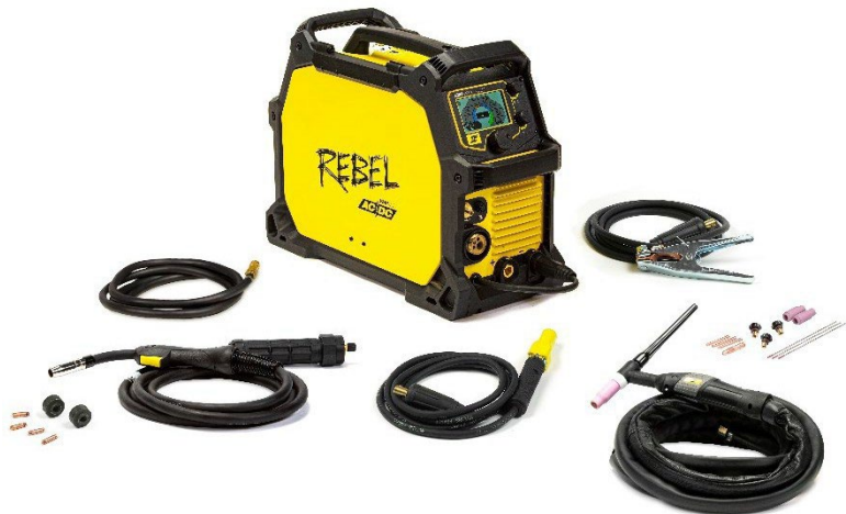
Rebel EMP 205ic AC/DC och tillbehör.