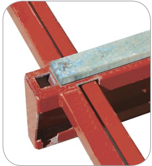
Sliteflate av impregnert tre