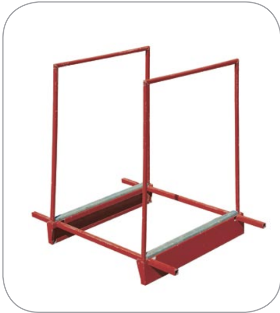
Solid metallplate- og rørkonstruksjon