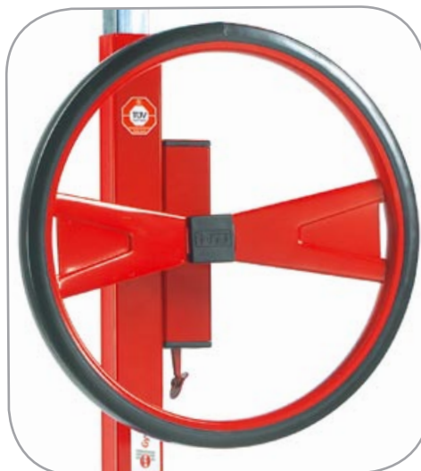
Ratt med sikkerhetssperre