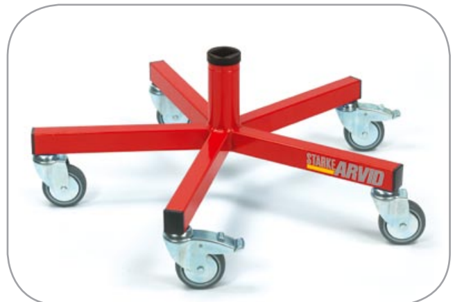
5 stk. leddhjul, hvorav 2 stk. låsbare