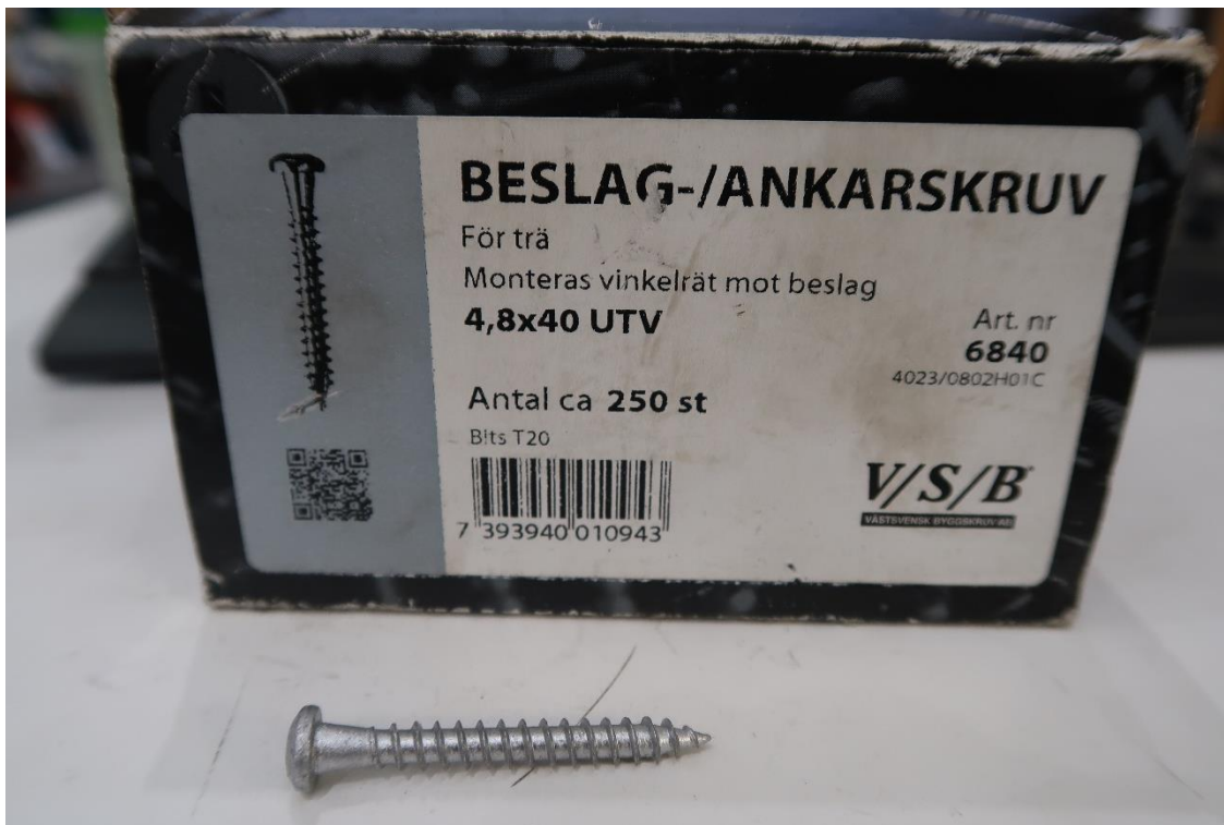
Figur 7 Ankarskruv 4,8x40