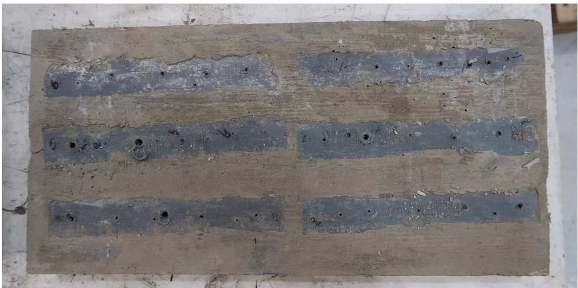
Figur 5 Ingjutna Gripcon-list, nr 1-6