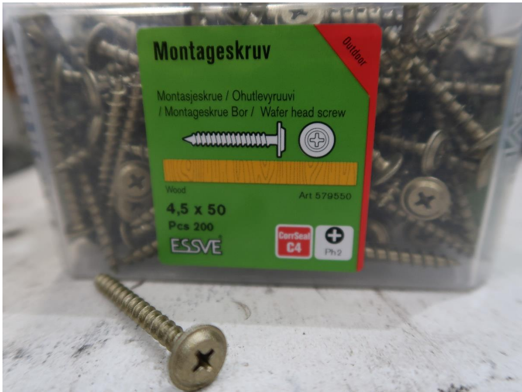
Figur 9 Montageskruv 4,5x50