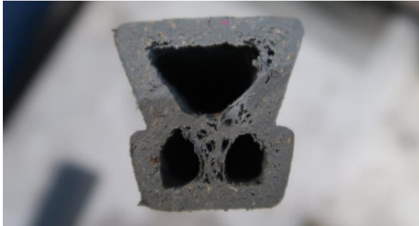
Figur 3 Gripcon-list, tvärsnitt