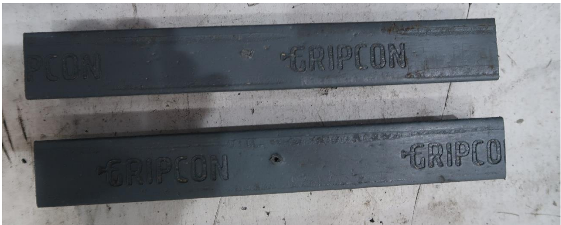
Figur 4 Gripcon-list, ovansida