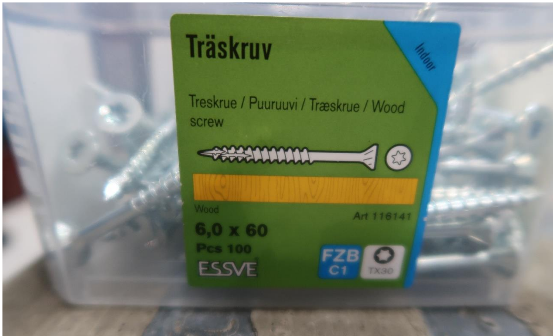
Figur 10 Träskruv 6x60