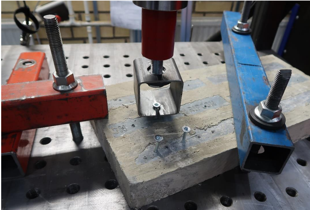
Figur 2 Provuppställning för utdragsprovning, provning av Träskruv 6x60