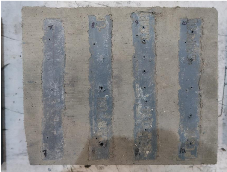
Figur 6 Ingjutna Gripcon-lister, nr 7-10