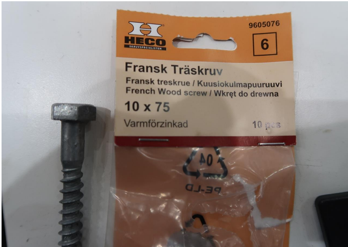
Figur 8 Fransk träskruv 10x75